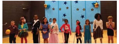
All the performers take a bow for their amazing talents!

Last Thursday, students representing 1st through 5th grades sang, danced, played instruments, told jokes, tumbled, and showed off their fierce ninja skills in the first annual DDES PTA talent show. Many thanks to the teachers, parents, and students who helped make the event a night to remember!