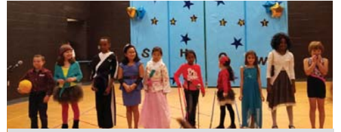
A todos los artistas, les felicitamos por sus excelentes cualidades!

El pasado Jueves, Enero 26, estudiantes de primero a quinto grado cantaron, bailaron, tocaron instrumentos, contaron chistes, tropezaron, y demostraron sus más feroces cualidades de Ninja en el Primer Evento anual de DDES/PTA show de talentos. Muchas gracias a los maestros, representantes y estudiantes que ayudaron a hacer de este evento una noche para el recuerdo.